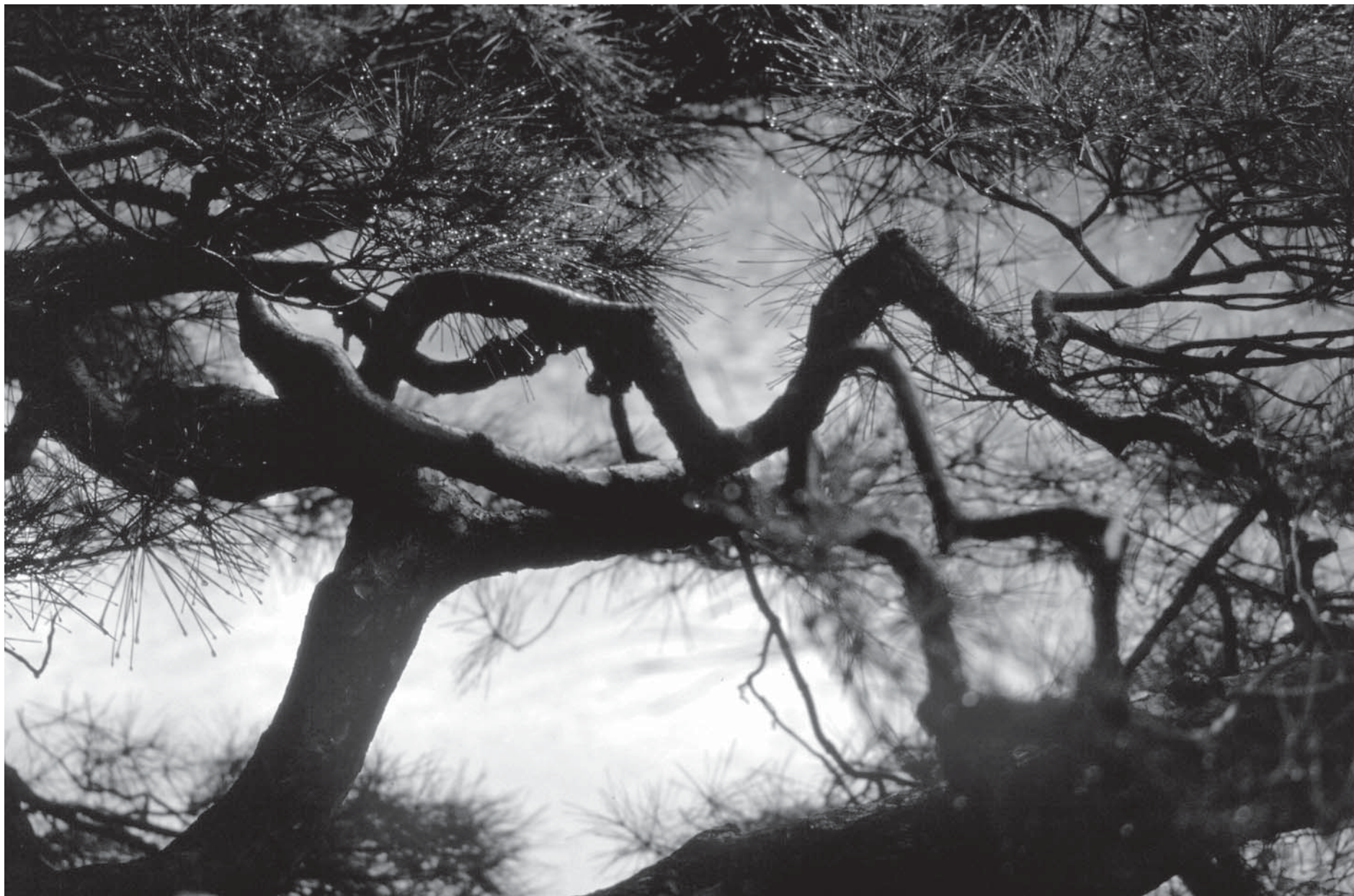
Vild natur, skabt gennem årtiers ombyggelig tildannelse, som ber et fyrretræ fra haven ved Katsura Rikyu